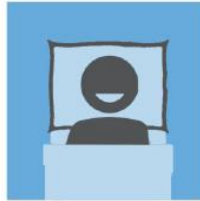
保持充足睡眠并均衡 饮食