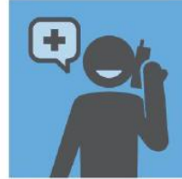
找医生就诊前，先打 电话