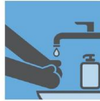
用水和肥皂勤洗手 (至少清洗 20 秒)