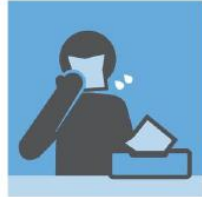
咳嗽或打喷嚏时，用纸 巾或衣袖遮住口鼻