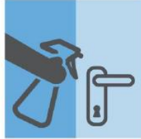
经常对“频繁接触的” 地方进行清洁和消毒