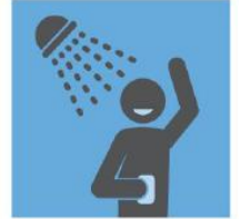
保持良好的卫生习惯